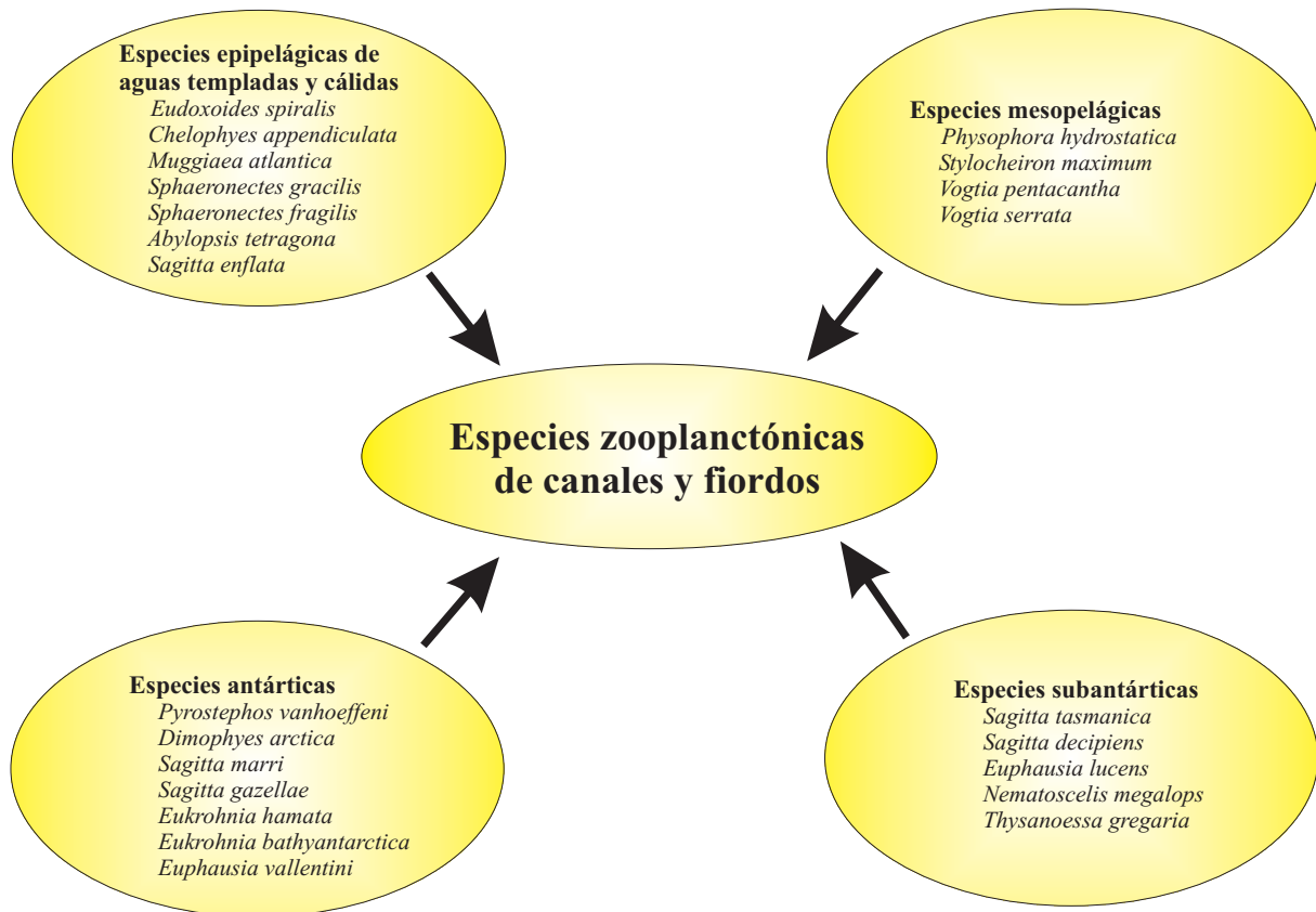
Figura 2: Orígenes biogeográficos de las especies zooplanctónicas capturadas en los canales y fiordos australes chilenos (Adaptado de Palma & Silva, 2004).

conocidas para cada uno de estos grupos de zooplancteres en los distintos océanos. Este porcentaje es similar al registrado en fiordos del hemisferio norte, como ocurre en fiordos escandinavos (Sands, 1980; Bamstedt, 1988) y canadienses (Richard & Haedrich, 1991). Además, estos resultados muestran que la mayor parte de los estudios efectuados por expediciones extranjeras se han centrado en la región magallánica. Por lo tanto, la mayoría de las especies identificadas entre Puerto Montt y el estrecho de Magallanes (Cruceros CIMAR 1 a 4), constituyen los primeros registros para este sector de canales y fiordos, ampliando así sus rangos de distribución geográfica en aguas del Pacífico suroriental. Además, la presencia de algunas especies, como los sifonóforos Physophora hydrostatica , Vogtia pentacantha y Vogtia serrata , y el cladóceros Podon leuckarti constituyen nuevos registros para aguas chilenas (Palma & Rosales, 1997; Rosenberg & Palma, 2003).